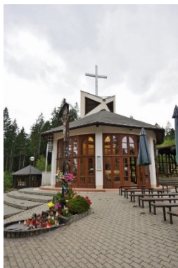
Kaplnka na Živčákovej